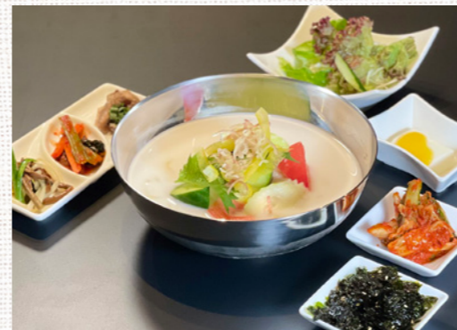
コンクッス (豆乳冷麺)