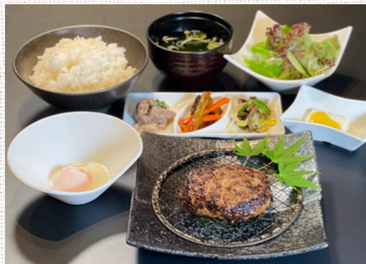
黒毛和牛の塩ハンバーグ

石焼ビビンバ + 焼肉もちょっと食べたい! ハラミ50g ..... 1,900円