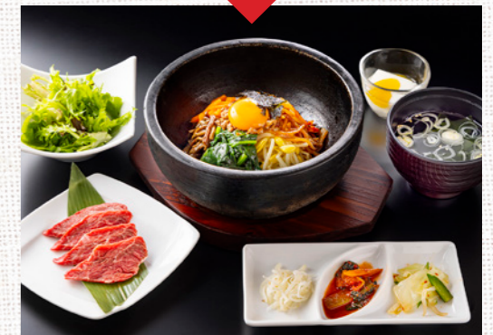
石焼ビビンバ+焼肉 (ハラミ 50g)

前菜 (自家製キムチ・ナムル・本日の初菜)・サラダ・プチデザート付。※わかめスープとごはんは、おかわり無料。